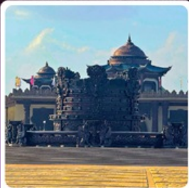
ศูนย์วัฒนธรรมหยวนหยิว