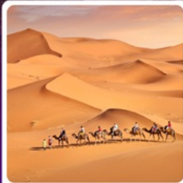
ทะเลทรายเสียนชวาน