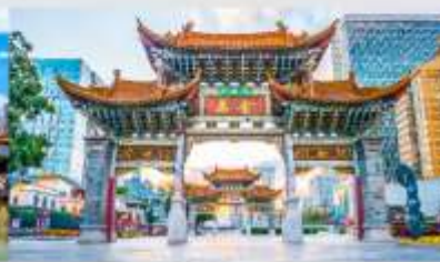
ประตูน้ำทอง ไถ่หยก

*ทางบริษัทฯ ขอสงวนสิทธิ์ในการสลับโปรแกรมทัวร์ตามความเหมาะสมขึ้นอยู่กับสถานการณ์ปัจจุบัน โดยคำนึงถึงผลประโยชน์ของลูกค้าเป็นสำคัญ