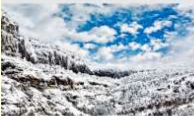
ภูเขาหิมะเจียวจื่อ