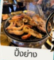
ปิ้งย่าง