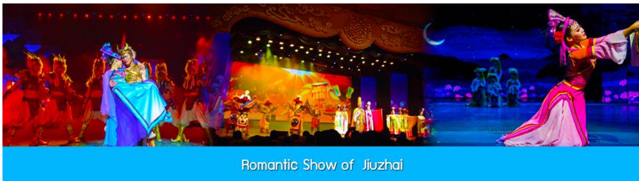
Romantic Show of Jiuzhai

หลังอาหารนำท่านสามารถเลือกซื้อรายการทัวร์เสริม พิเศษการแสดง ชุด Romantic Show of Jiuzhai เป็นการแสดงที่จัดขึ้นในโรงละครขนาดใหญ่ โดยการทุ่มทุนสร้างมหาศาล ทั้งเวที ฉากการแสดง ระบบ แสง สี เสียงที่ไฮเทค และทีมนักแสดงคัดสรรจากโรงเรียนนาฏศิลป์ เป็นการร้อยเรียงเรื่องราวของชนพื้นเมือง ประเพณีท้องถิ่น และเรื่องราว ตำนานในอดีต มาถ่ายทอดเป็นรูปแบบการแสดงที่อลังการละประทับใจ.....อัตราบัตรเข้าชม 400 หยวน หรือ 2,000 บาท/ท่าน หรือสอบถามรายละเอียดเพิ่มเติมได้ จากไกด์ท้องถิ่นหรือหัวหน้าทัวร์