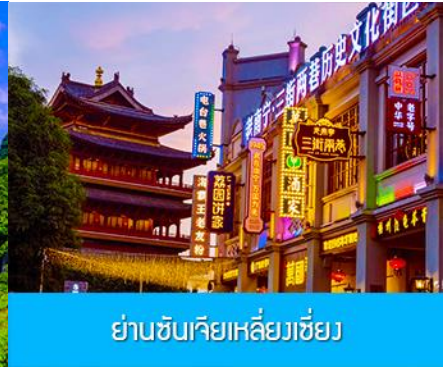
ย่านชุนเจียเหลียงเซียง