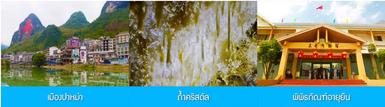
เมืองปาหม่า

พักที่ NANNING UNIVERSAL HOTEL โรงแรมระดับ 4 ดาวท้องถิ่น หรือเทียบเท่าในเมืองหนานหนิง