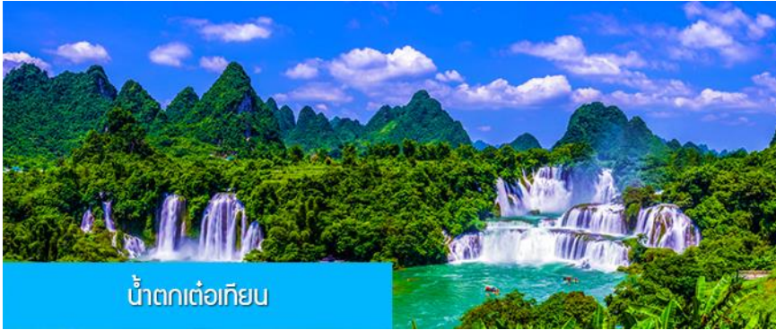
น้ำตกต๋อเทียน