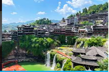
เมืองโบราณฝูหวงเจิน

วันที่สาม เมืองจางเจียเจีย-ตึกมหัศจรรย์ 72 ชั้น-พิพิธภัณฑ์ภาพหินทราย –ศูนย์แพทย์แผนจีน-เมืองโบราณฝูหวงเจินยามค่ำคืน