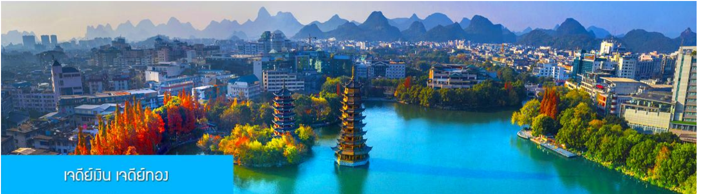
เจดีย์วิน เจดีย์ทอง