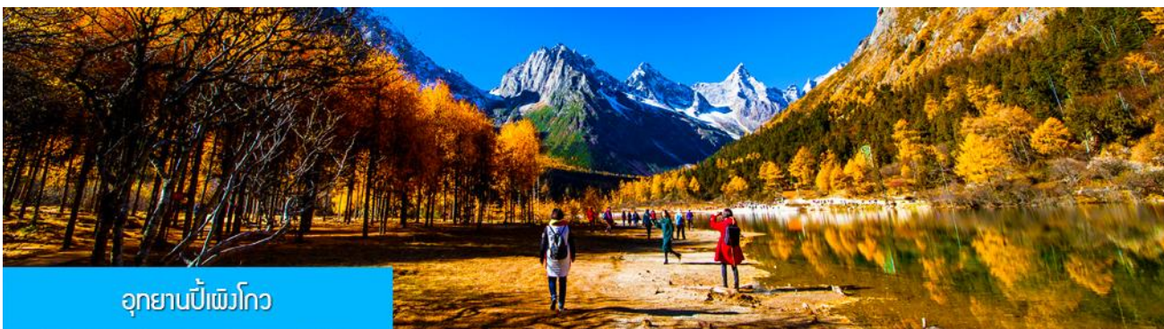
อุทยานปีเพิงโกว

พักที่ SIGUNIANGSHA HOTEL 4* หรือ โรงแรมระดับเดียวกันพื้นเมือง