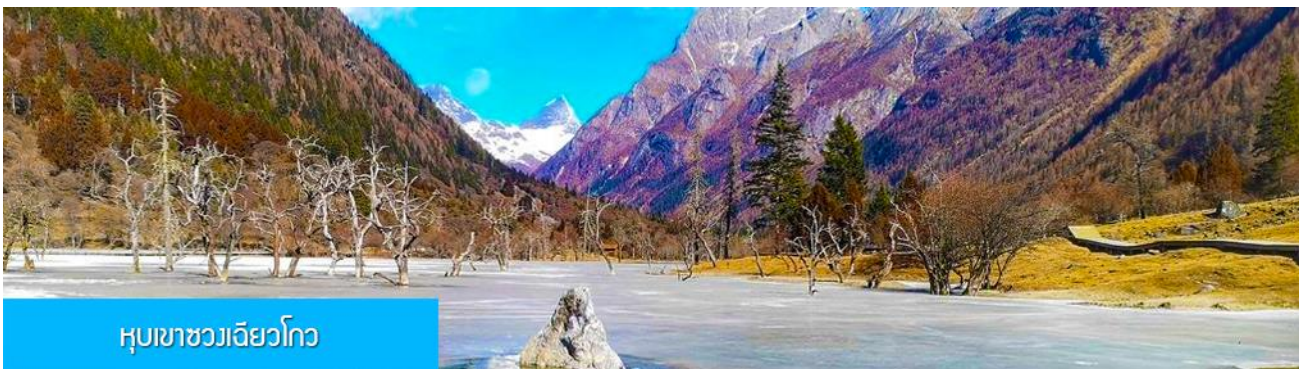
หุบเขาชวงเฉียวโกว

นำท่านเที่ยวชม หุบเขาชวงเฉียวโกว 双桥沟景区 ที่เป็นแหล่งท่องเที่ยวที่สวยงามที่สุดแห่งหนึ่งในเขตอุทยานสี่ครุณี นำท่านนั่งรถบัสของอุทยานที่วิ่งไปผ่านเส้นทางที่สร้างคู่ขนานกับลำธารภายในหุบเขา ท่านจะได้สัมผัสกับความสวยงามของทัศนียภาพธรรมชาติที่หาชมได้ยาก โดยมีภูเขาหิมะสูงตระหง่านอยู่เบื้องหลัง ธารน้ำใสไหลริน และสระน้ำที่มีสีเขียวมรกต ในฤดูใบไม้ผลิและฤดูร้อนท่านจะได้เห็นฝูงจามรีท่ามกลางทุ่งหญ้าเขียวจี ส่วนในฤดูหนาวทุ่งหญ้าและพื้นดินจะปกคลุมด้วยพรมหิมะสีขาว.. รถบัสของอุทยาน