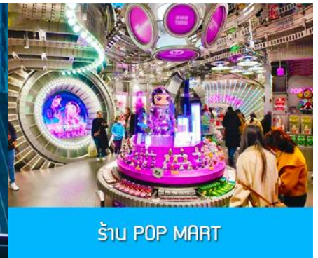
ร้าน POP MART

วันที่ห้า เหยสุย-ตูเจียงเยียน-ตุ๊กตาแพนด้านอนเซลฟี-เจิงตู