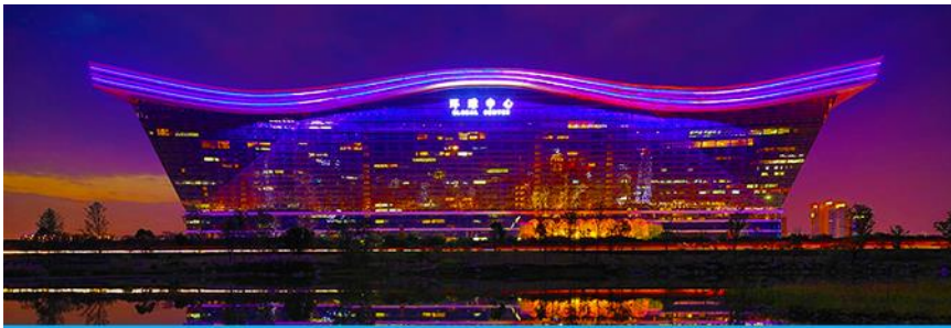
Chengdu new century global center