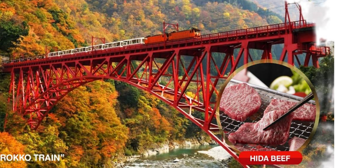
“KUROBE TOROKKO TRAIN”