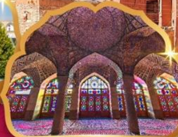
Nasir al Molk Mosque