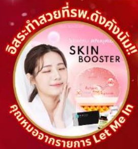
อิสระทำสวยที่พ.ดังคังนัม!! SKIN BOOSTER คุณงามความดี Let Me In

ชมจอ LED ขนาดยักษ์ที่รีสอร์ท 5 ดาว ใหญ่ที่สุดในเอเชียเหนือ ชมพระราชวังคยองบกกุง ย่านฮอนดัตหมู่บ้านบุคซอน ฮันอก ใส่ชุดฮันบก ทำข้าวห่อสาหร่าย อิสระช้อปปิ้ง Lotte Duty Free