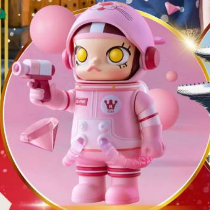
POP MART ฮงแด