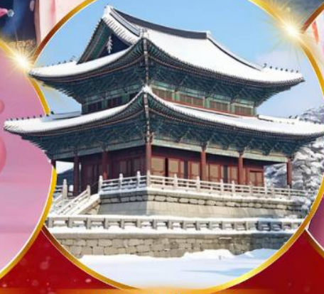
พระราชวังเคียงบกกุง