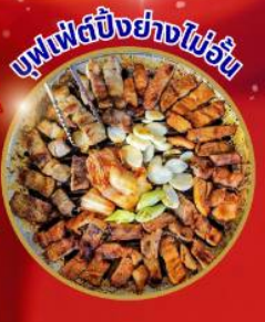
บุฟเฟ่ต์ปิ้งย่างไม่วัน