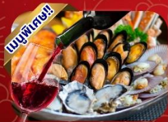
ซีฟู้ดไฮน์แดง