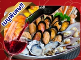
ซีฟู้ดไฮน์แดง