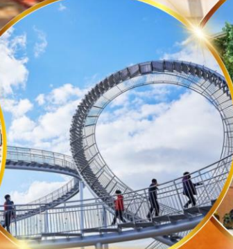
โพฮังสเปซวอล์ค