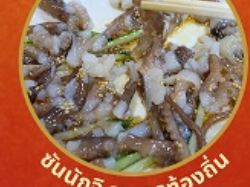
ชั้นนักชี อาหารท้องถิ่น