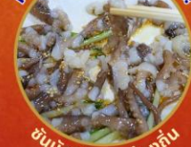
ซันนิกอิ อาหารท้องถิ่น