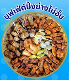
บุฟเฟ่ต์ปิ้งย่างไม่อื่น