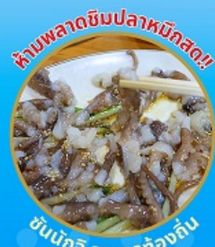
ห้ามพลาดชิมปลาหมึกสด!!

ถ่ายรูปชิคๆ หมู่บ้านวัฒนธรรมคิมซอน ใหม่ล่าสุด คาเฟ่ริมทะเล วิวหลักล้าน ขึ้นเคเบิลคาร์ ชมทะเลปูซาน ห้ามพลาด!! ตลาดปลาที่ใหญ่ที่สุด ชิมของอร่อยที่ตลาดแฮอนแด ช้อปปิ้งตลาดพื้นเมือง แหล่งช้อปปิ้งใต้ดิน ซัมซอน อิสระช้อปปิ้ง Lotte Duty Free