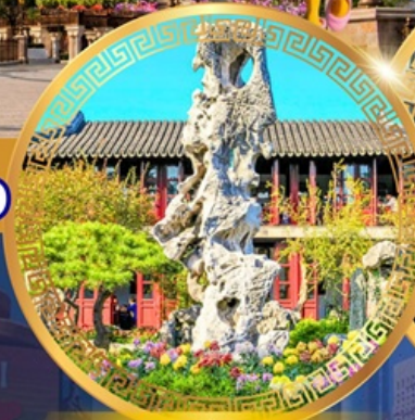
สวนหลิวหยวน

ถนนหนานจิงลู่ หาดไว่ทาน ชมหอไข่มุก ล่องเรือทะเลสาบซีหู ตำนานพญางูขาว เจดีย์เหลยเฟิง ถนนเลี้ยวเหอจือเจีย วัดหลงหยวน สวนหลิวหยวน ซุปป์ปิง ถนนกวนเจียนเจีย ถนนซีหลี่ซานถึง วัดพระหยก เซคอินย่านเก่าซิ่นเทียนตี้ สักการะศาลเจ้าพ่อหลี่ก๊กเมือง