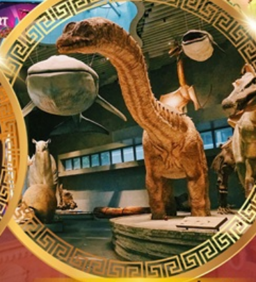
พิพิธภัณฑ์ธรรมชาติเซี่ยงไฮ้