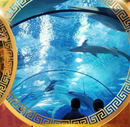
เซี่ยงไฮ้อาเซียนอะควาเรียม