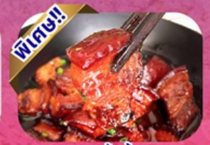
หมูสามชั้นน้ำแดง