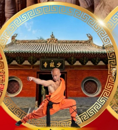
วัดเล่าหลิน