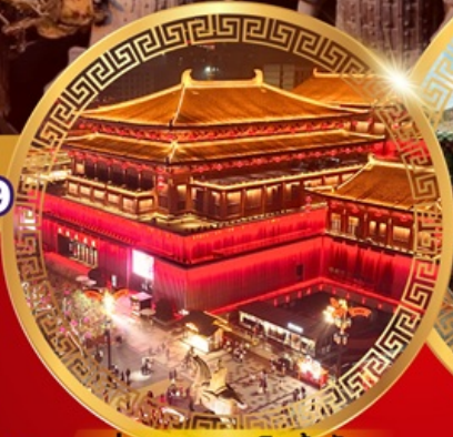
ย่านถนนคนเดินต้าถิง