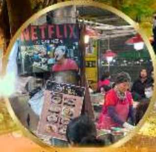
สตรีทฟู้ดตลาดกวางจ้ง