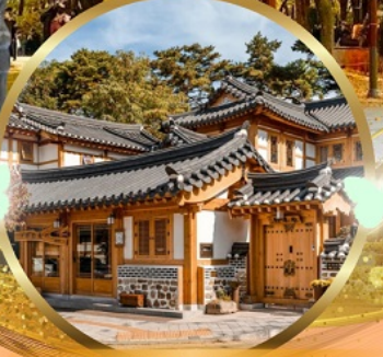
หมู่บ้านโบราณอินพยอง