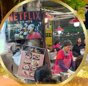
สตรีทฟู้ดตลาดกวางจง

สนุกสุดเหวี่ยงกับกิจกรรมขับริล LUGE !! พิเศษ !! นั่งกระเช้าชมวิว 360° เมืองคังฮวา