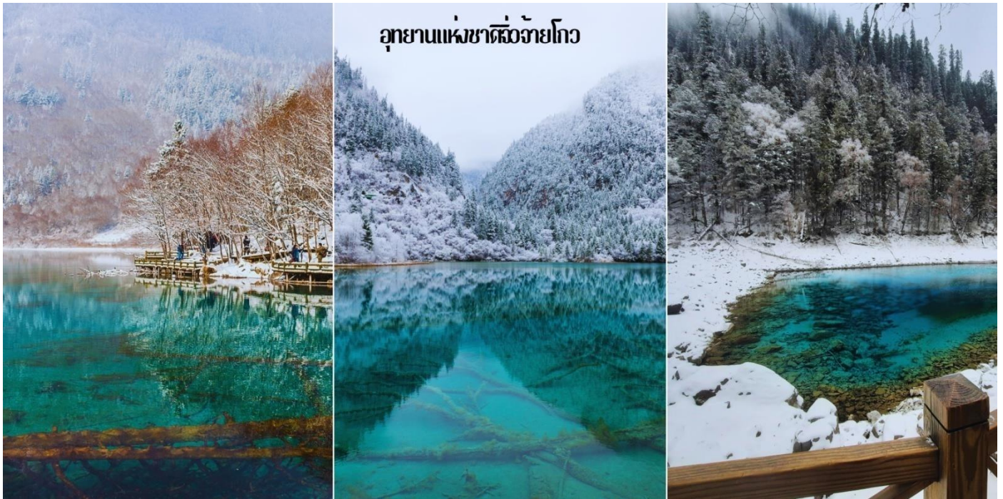
อุทยานแห่งชาติจิวจ้ายโกว