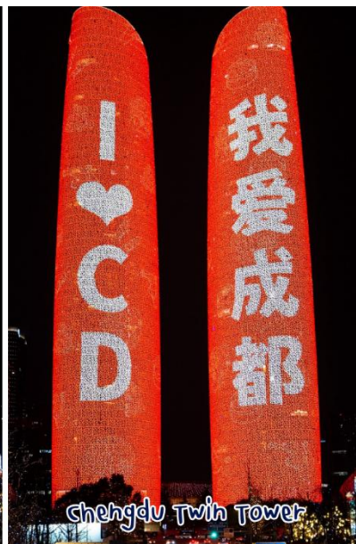
Chengdu Twin Tower