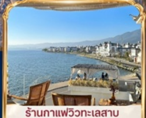
ร้านอาหารแพรวทะเลสาบ BAN SHAN YUE (รวมค่าเช่า ไม่รวมเครื่องดื่ม และค่าเช่าเสื้อผ้ารูป)