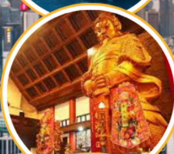
ไหว้พระวัดดั่ง