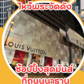
ช้อปปิ้งสุดมันส์ ที่ถนนนทราณ