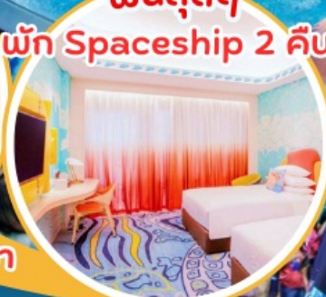
ฟินสุดๆ พัก Spaceship 2 คืน!!