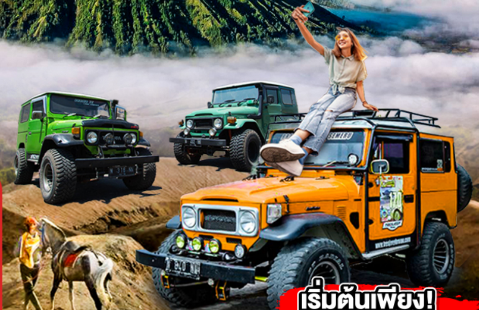
ชมประตูลมปุยปางค์