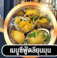
เมมูซีฟู้ดลึยมูนูน