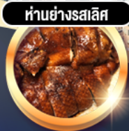
ห่านย่างสไลส