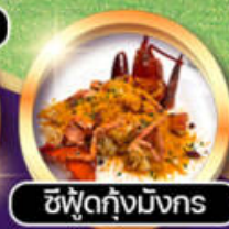
ซิวัดกึ่งมังกร