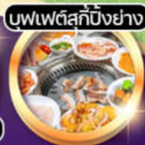
บวฟเต็สกีบียงย่าง