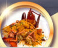
ซิวัดกึ่งมิงท