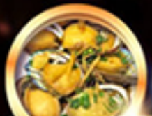
เมนูซีฟู้ดสัญจร