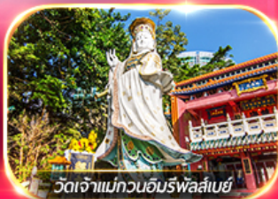
วัดเจ้าแม่กวนอิมรพหลัสเบย์