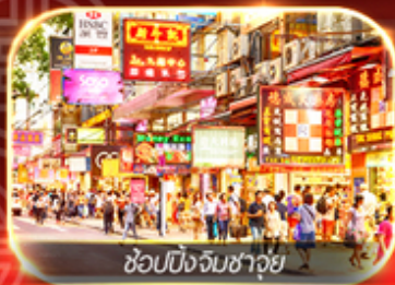
ช้อปปิ้งจิมซาจุ่ย