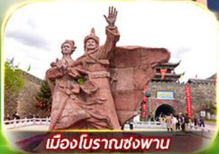
เมืองโบราณซ่งพาน