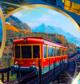
รถราง ซาปา