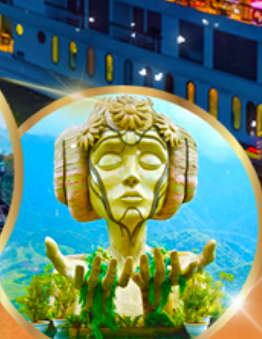
โมนาน่า คาเฟ่