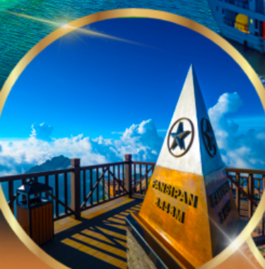
ยอดเขาฟานซีปัน

พักโรงแรม ★★★★★ GRAND SILK PATH SAPA HOTEL 2 คืน ROYAL CASINO HALONG HOTEL 1 คืน