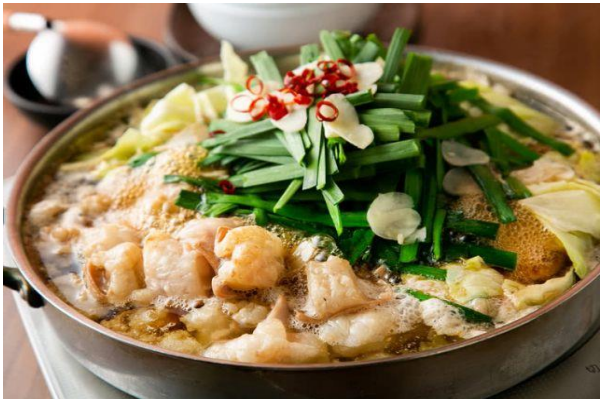
ร้านอาหารย่านยะไต (YATAI)

เย็น อิสระรับประทานอาหารค่ำตามอัธยาศัย เพื่อให้ท่านได้ช้อปปิ้งอย่างเต็มที่ (มีไกด์แนะนำ) ➡ พักค้างคืน ณ โรงแรม Nishitetsu Inn Hotel (★★★★) หรือเทียบเท่า ใจกลางย่านเทนจิน