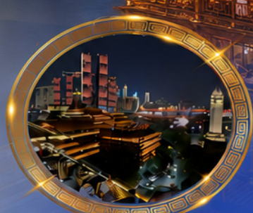
มือค้ำร้านอาหารวิวหลักล้าน ชมแสงสีเมืองลงซิ่ง