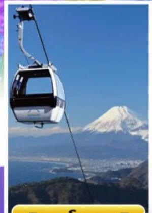
อิซุฟานรามาวิว