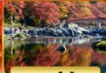
หุบเขาโคริงเค