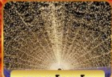
น้ำตกนิชิโนะซากิ