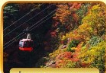
นั่งกระเช้าภูเขาโทไซโซ