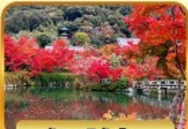
วัดเออิทังโด