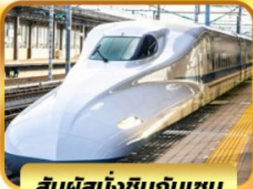
สัมผัสนั่งชินกันเซน