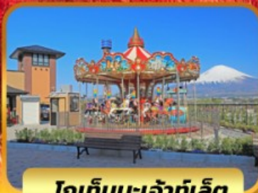
โกเท็มบะเจ้าท์ไลท์