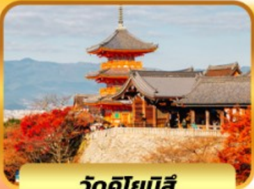
วัดคิโยมิจิ