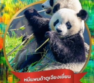
หมีแพนด้าเจียงเยี่ยน