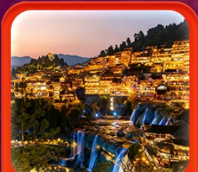
"เมืองโบราณฟูหลงเจิน"