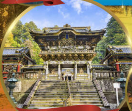
ศาลเจ้ามิกโกโทโทกุ