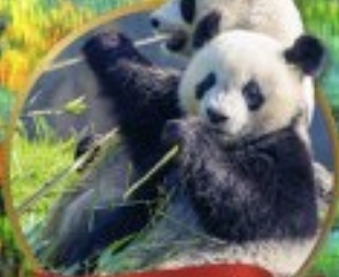
หิมะแพนด้ายักษ์เมืองเหมิน