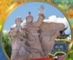
เมืองโบราณชงฟาน