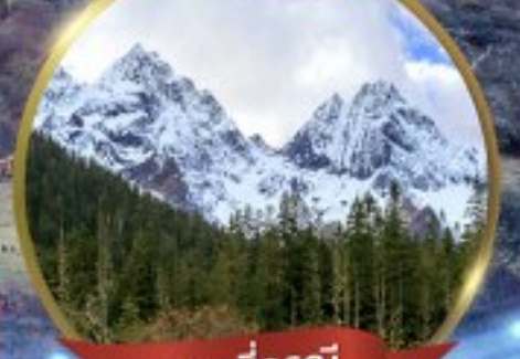
ภูเขาสี่ฤดู