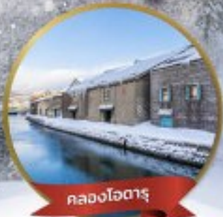
คลองไอตารุ