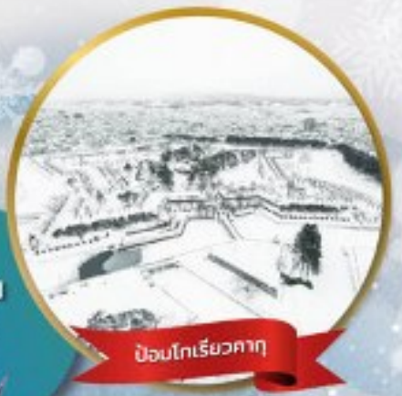
ป้อมโกเรียวกาคุ