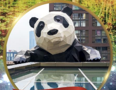
แพนด้ายักษ์ป็นตึก

มหัศจรรย์ความงาม อุทยานจิวจ้ายโกว (รวมรถเหมาเที่ยวอุทยานเต็มวัน) ชมอุทยานหวงหลง (รวมกระเช้า) • สี้ดรุณี • อุทยานของเจียวโกว (รวมรถอุทยาน) เมืองเก่าชงพาน • ถนนคนเดินจิมหลี่ + ไท่กูหลี่ • ชมแพนด้ายักษ์ป็นตึก