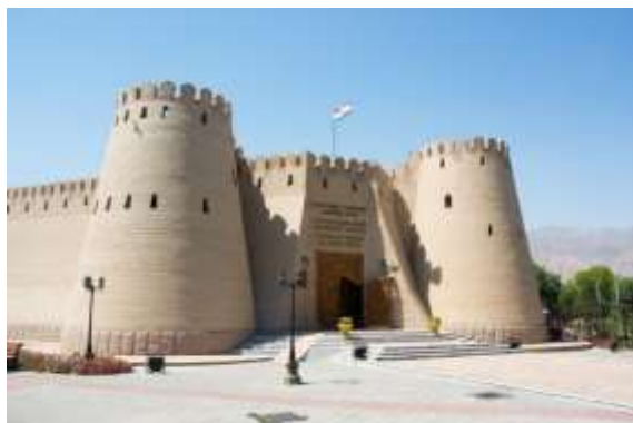
ปราสาททาเมมาริค

นำท่านเข้าสู่ที่พัก Parliament Palace Hotel หรือเทียบเท่า