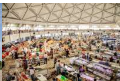
ตลาดคอร์ซู