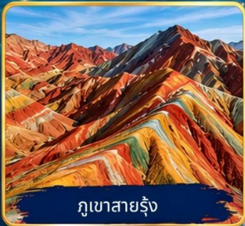
ภูเขาสายรุ้ง