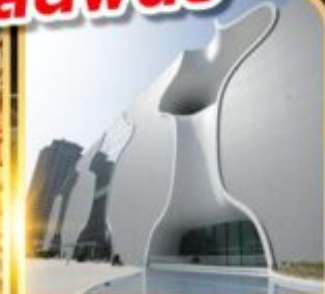
โรงละครโดจง