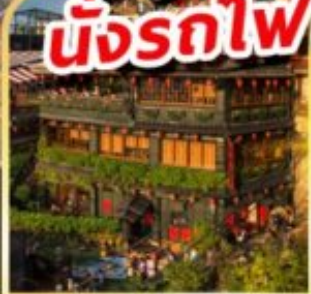
หมู่บ้านโบราณฉิวเฟิน