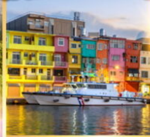
ท่าเรือประมงเจิ้งปิน