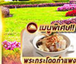
เมนูพิเศษ!! พระกระโดดกำแพง