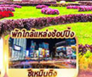
พิกโกลิแหล่งช้อปปิ้ง ซีเหมินติง